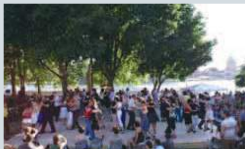
Eterna Milonga en plein air, quai de la Daurade Tangopostale 2010