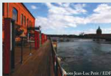
Espace EDF Bazacle

Dans le cadre magnifique de l'Espace EDF Bazacle, grâce au soutien d'EDF, de la Caisse Mutuelle Complémentaire d'Activités Sociales EDF GDF et du Groupe Cahors, Tangopostale vous invite à un concert intimiste (Mardi 03 Juillet à 19h) suivi d'un bal, qui, si le temps le permet, se tiendra sur la terrasse en surplomb de la Garonne.