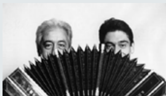
Le quartet JJ Mosalini

Pour le grand concert du jeudi 3 juillet à l'Auditorium Saint Pierre des Cuisines