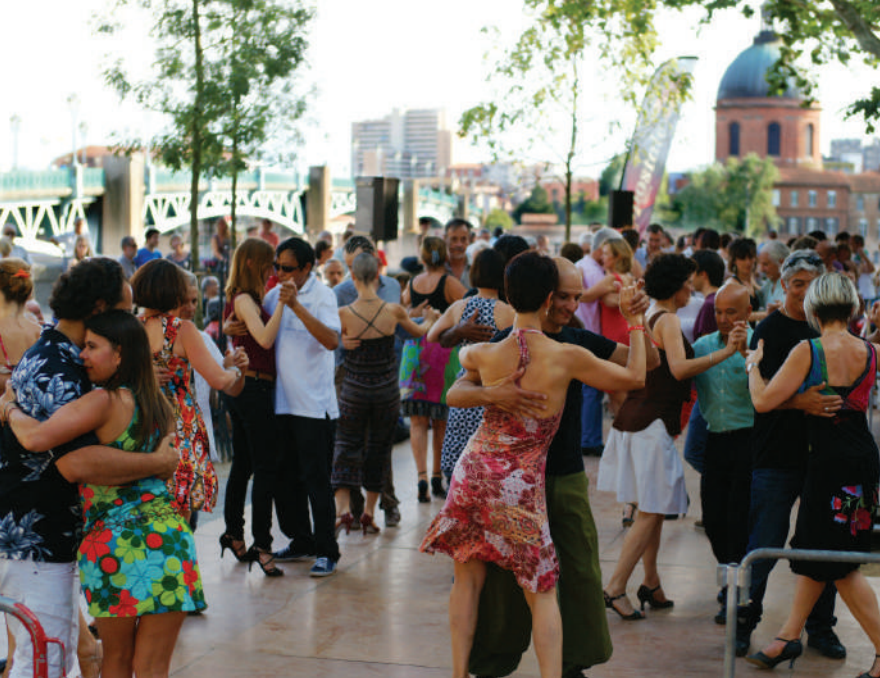
Eterna Milonga, place Saint-Pierre. Le rendez-vous incontournable des tangueros !