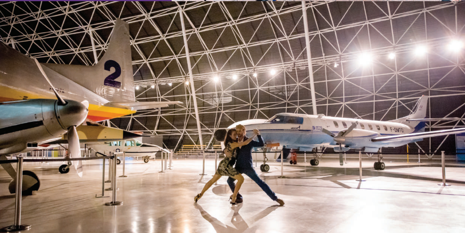
Des événements originaux qui ont marqué les esprits ! Ouverture du festival 2017 au musée Aeroscopia.