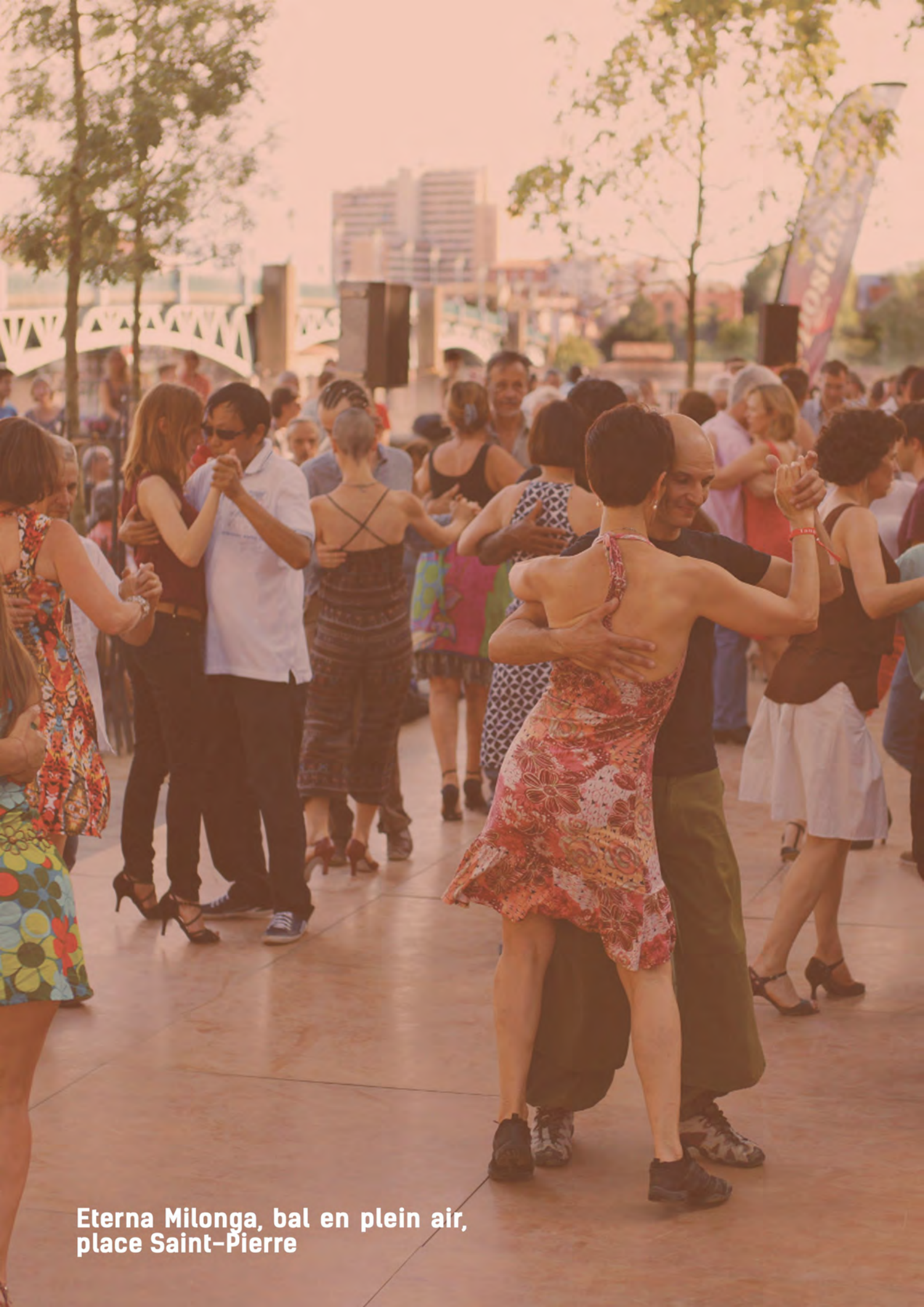
Eterna Milonga, bal en plein air, place Saint-Pierre